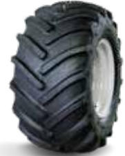
31x15.50-15 AS Profil