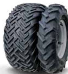
33x15.50-15 mit 7.50-16 AS