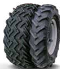
31x15.50-15 mit 6.50-16 AS

Keine Einschränkung bei Lenkeinschlag und Vorderachspendelung!