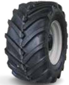
425/55 R17 AS Profil