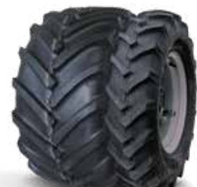
425/55 R17 mit 7.50-18 AS