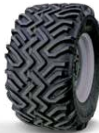
440/50 R17 All Ground